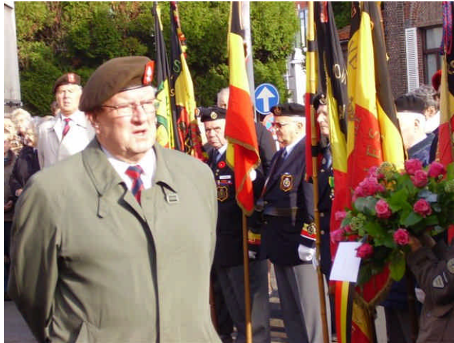
Appel aux morts par Georges DE CREMER Dodenappel door Georges DE CREMER

C'est le 8 novembre que nous commémorions à EKE les Grenadiers tombés le dernier jour de la 1 ère Guerre mondiale de même que les victimes civiles de la Commune.